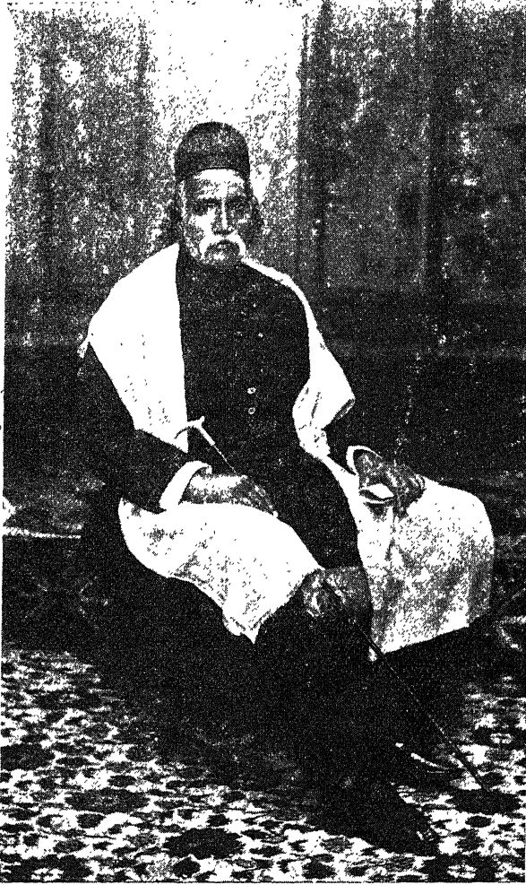
उपाध्याय पं० बदरीनारायण चौधरी 'प्रेमघन' ( सभापति तृतीय हिन्दी साहित्य सम्मेलन )